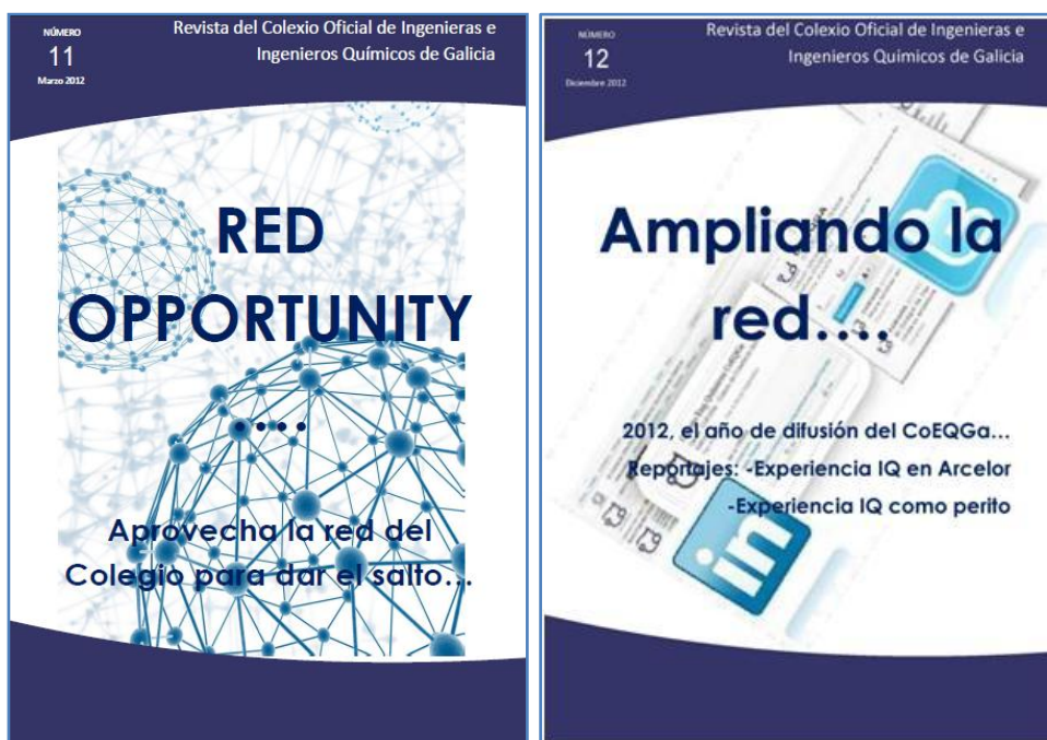
Ejemplares números 11 y 12 de la revista del COEQGa

La revista estrenó nuevos apartados en 2012, tratando temas relacionados con la Ingeniería Química, con la profesión de Ingeniero Químico y con el propio Colegio. Se han publicado dos nuevos números (11-Marzo y 12-Diciembre):